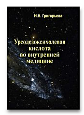
Урсодезоксихолевая кислота во внутренней медицине