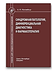
Синдромная патология, дифференциальная диагностика и фармакотерапия