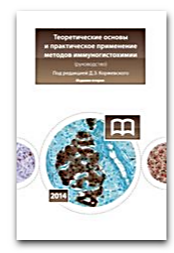
Теоретические основы и практическое применение методов иммуногистохимии