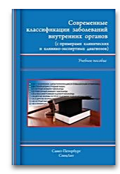
Современные классификации заболеваний внутренних органов