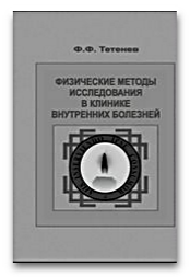
Физические методы исследования в клинике внутренних болезней