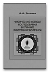
Физические методы исследования в клинике внутренних болезней