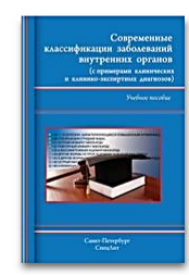
Современные классификации заболеваний внутренних органов