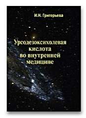
Урсодезоксихолевая кислота во внутренней медицине