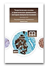
Теоретические основы и практическое применение методов иммуногистохимии