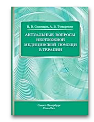
Актуальные вопросы неотложной медицинской помощи в терапии

- Теперь Пользователь прикреплен к институту и имеет доступ к подпискам института и к полному функционалу своего личного кабинета.