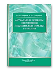
Актуальные вопросы неотложной медицинской помощи в терапии

- Пользователь сразу прикреплен к институту. Он имеет доступ ко всем подпискам института и к полному функционалу своего личного кабинета. Доступ возможен даже из дома.